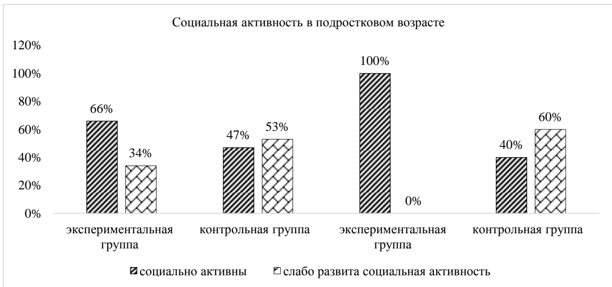
Рисунок 3. – Сравнительные результаты изучения социальной активности подростков на констатирующем и контрольном этапах эксперимента