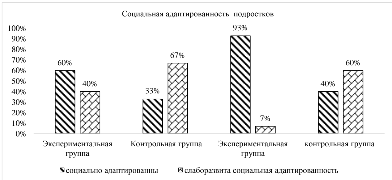
Рисунок 1. – Сравнительные результаты изучения социальной адаптированности подростков на констатирующем и контрольном этапах эксперимента

На рисунке 1 мы представили результаты диагностики по критерию социальной адаптированности подростков на констатирующем и контрольном этапах эксперимента в сравнении.